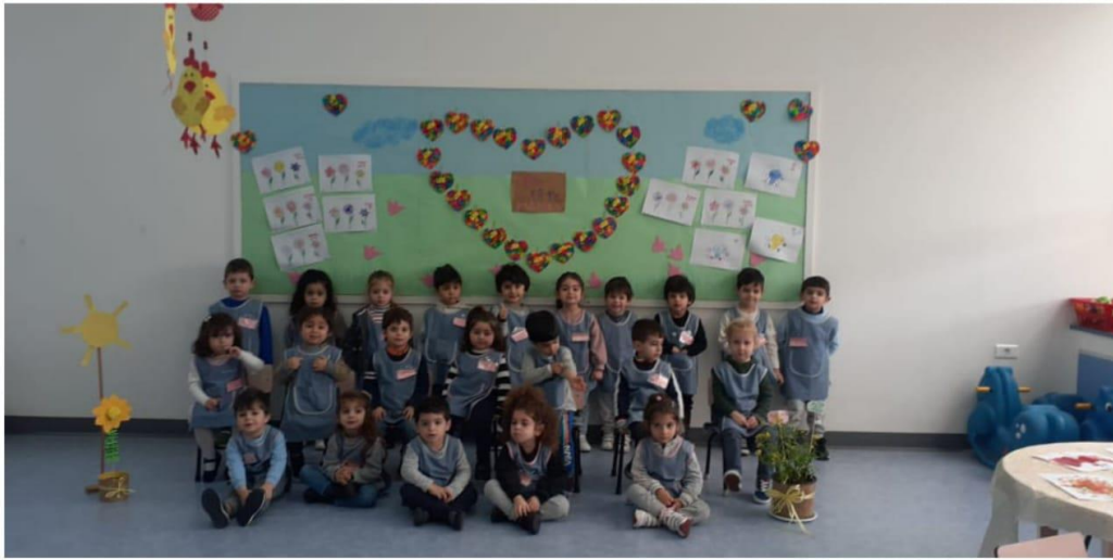
Notre coin de plantation.